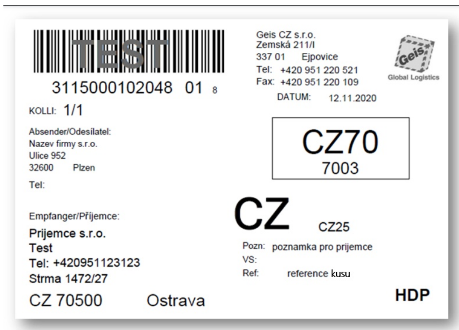
Obrázek 7: Náhled štítku - zásilka se službou HDP (případně HDS).