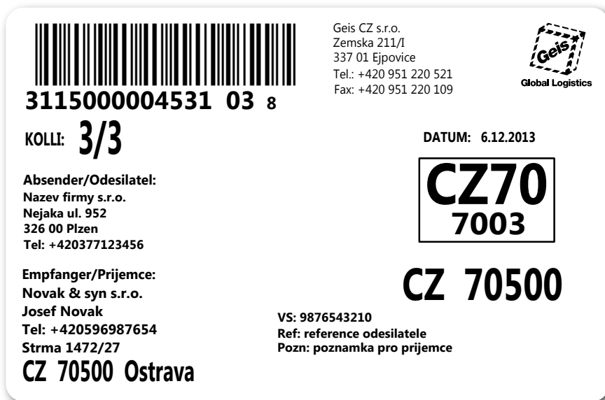
Obrázek 6: Náhled štítku – zásilka se třemi kusy.