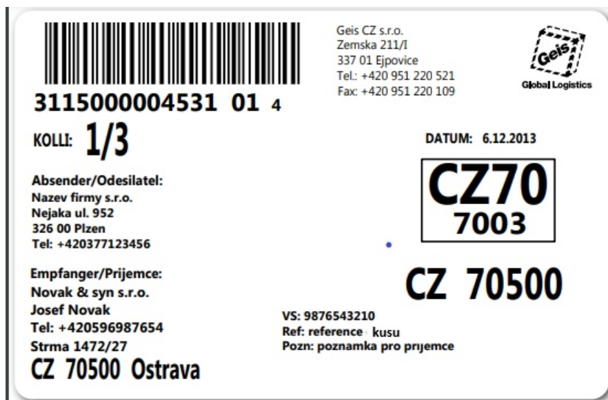
Obrázek 4: Náhled štítku – zásilka se třemi kusy.