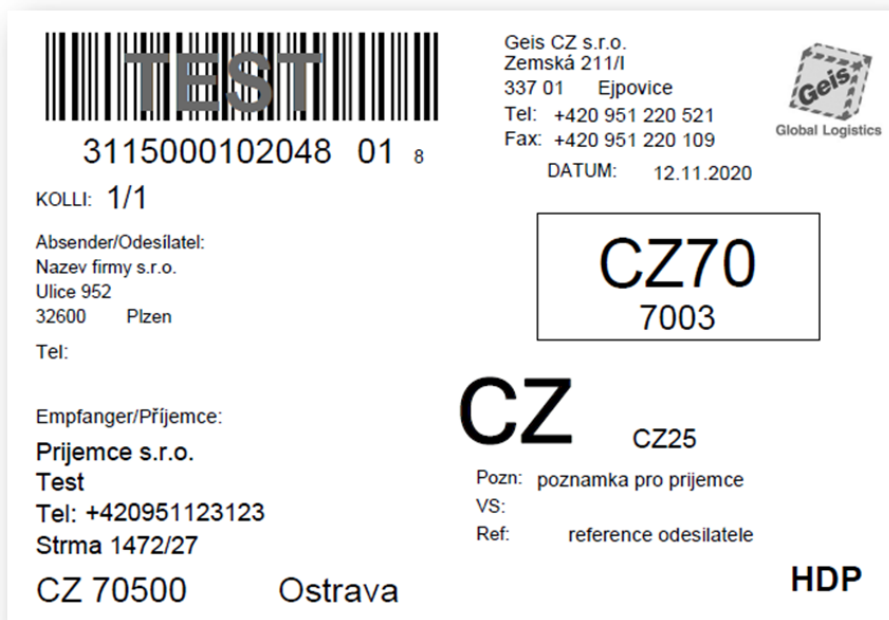
Obrázek 7: Náhled štítku - zásilka se službou HDP (případně HDS).