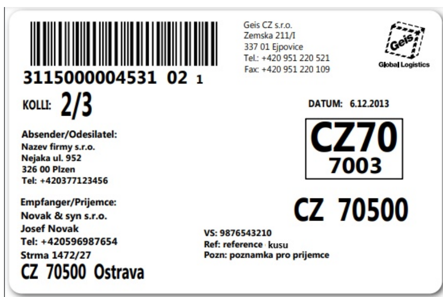
Obrázek 5: Náhled štítku – zásilka se třemi kusy.