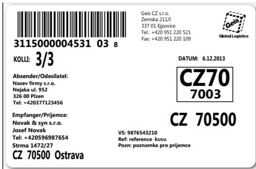
Obrázek 6: Náhled štítku – zásilka se třemi kusy.