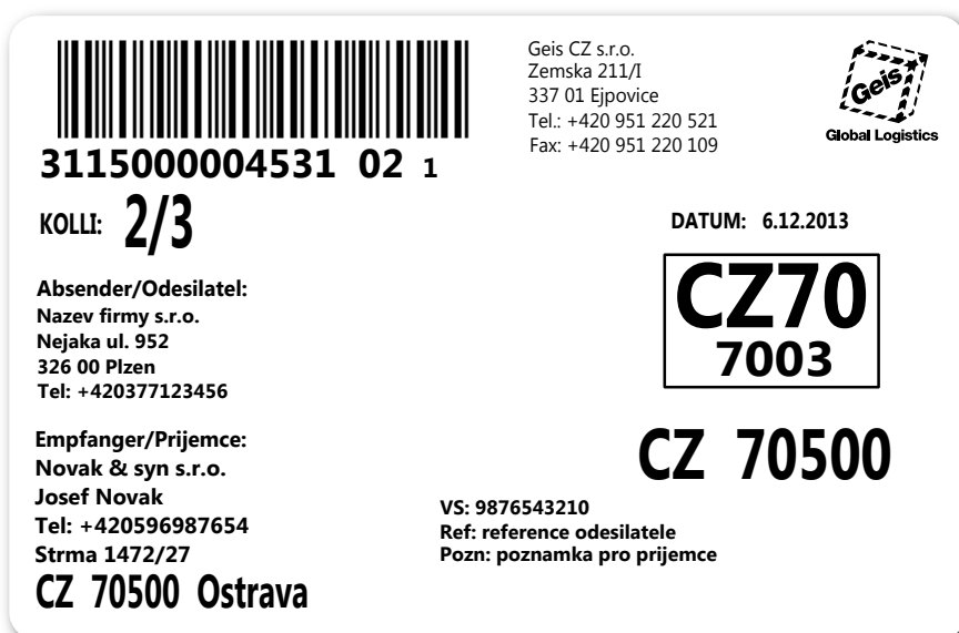
Obrázek 5: Náhled štítku – zásilka se třemi kusy.